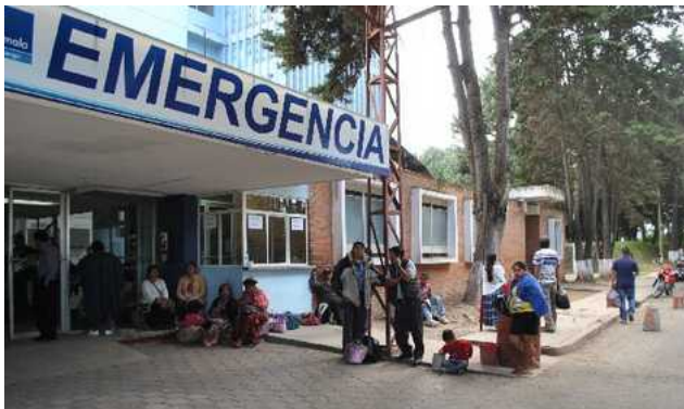
En lo que val del año, en el nosocomio de Xela se han atendido a ocho menores de edad que han dado a luz. 1 de 1